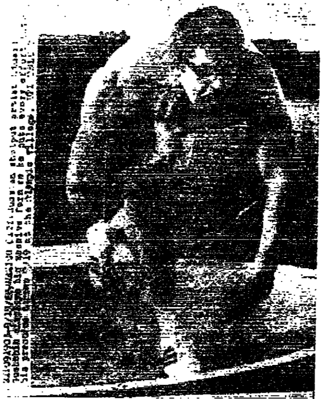
اللاعب الروسي ادوارد غوميشين يعرض قوته الجذبية المائلة خلال تدريباته على رمي الكرة في مدينة الامتلاب الالمانية

رئاسة اركان الجيش العربي بحلجة الى لوزان سلكة ، فعلى المعهدين الراغبين بتحويل المناقصات الرجعة قيادة سلاح اللامسلي الملكي في رئاسة الاركان واتناء ساعات الدوام الرسمي للاطلاع على المواد المطلوبة . يقبل التناقصات من اليوم وحتى الساعة التاسعة من صباح يوم الثلاثاء الموافق ٢٤ تشرين اول ١٩٦٨ .